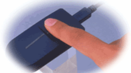
指紋認証ユニット 本体価格19,800円(税込20,790円)

登録拒否率0%、「周波数解析法」という新しい指紋認証アルゴリズムを利用した「e-UBF」(エンタープライズ 指紋認証ソリューション)。